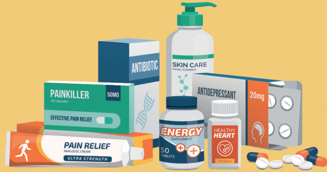
Médicaments non utilisés, périmés ou usagés