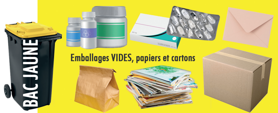
Emballages VIDES, papiers et cartons