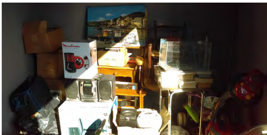
Le fruit d'une permanence récup' dans une seule déchetterie : des dizaines d'objets en bon état qui ont rejoint les étagères de la Recyclerie de Cusset

Une fois collectés, ces objets sont entreposés dans l'atelier de la Recyclerie où ils sont triés, vérifiés, testés, nettoyés, réparés ou relookés pour pouvoir être vendus dans le magasin. L'objectif est de leur rendre une nouvelle utilisation possible. Les objets qui ne peuvent être remis en état pour la vente sont envoyés vers d'autres filières de recyclage.