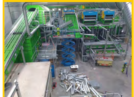
Implantation des machines de tri

Propriété d'ALLIER TRI, le centre de tri est exploité par la société VEOLIA.