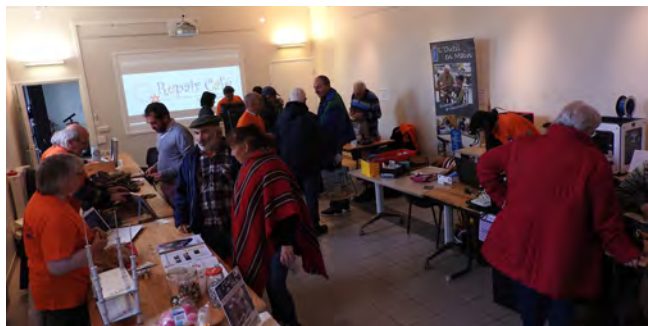
La 2 ème édition du Repair Café avec le FabLab Lapalisse