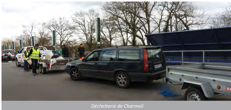
Déchetterie de Charmeil

Les volumes de déchets supérieurs à 5 m 3 usager/semaine ne seront autorisés qu'au cas par cas , en fonction de la place disponible dans les bennes. Il convient donc de contacter la déchetterie avant de s'y rendre.