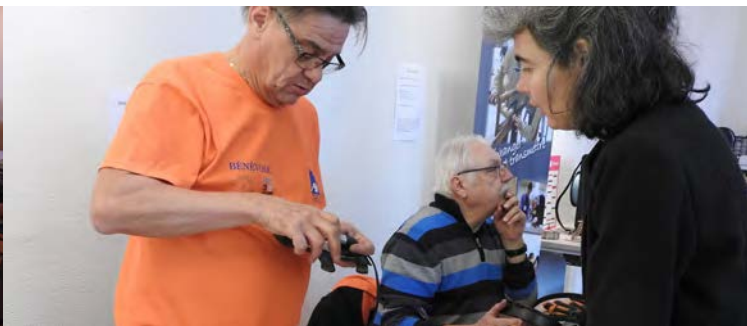
Partage de connaissances, échange d'astuces... en toute convivialité