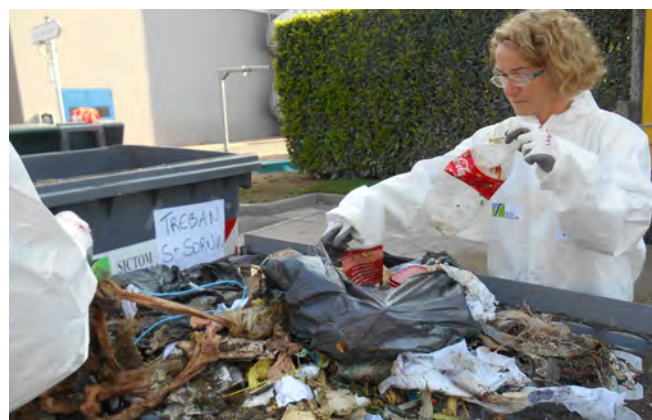
Caractérisation des ordures ménagères

Pour ce faire, un programme d'actions est déployé sur l'ensemble du territoire depuis presque 10 ans : compostage des déchets organiques en établissements (dans les cimetières, au sein des résidences ou des hameaux) ; lutte contre le gaspillage alimentaire dans les selfs des collèges et lycées ; développement du réemploi et de la réparation... Bien évidemment, la simplification des consignes de tri pour les emballages et papiers contribuera, nous l'espérons, à généraliser le geste de tri à l'ensemble de nos usagers et à capter ainsi 100% de ces produits.