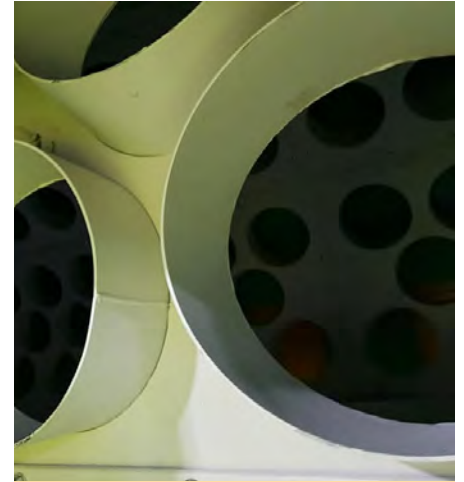
Vue de l'intérieur du trommel, au centre de tri

pour pouvoir créer une filière. Ces emballages sont alors dirigés vers la valorisation énergétique, à l'UVEOM de Bayet où ils contribueront à produire de la vapeur brute qui est ensuite dirigée vers l'équarrissage SARVAL.